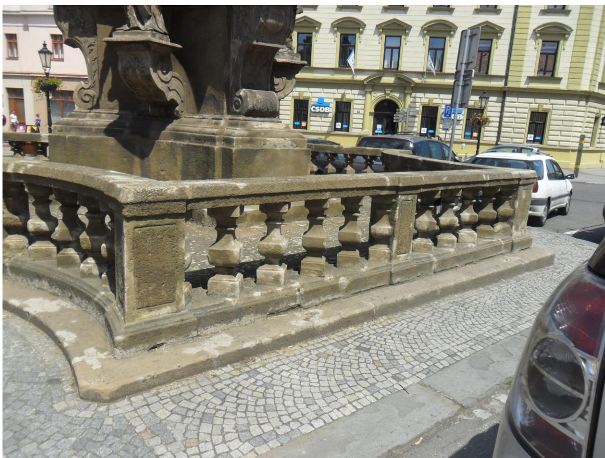
Kroměříž, sloup Nejsvětější Trojice, 2018

Nahoře – segmentová část balustrády na pravé straně sloupu.